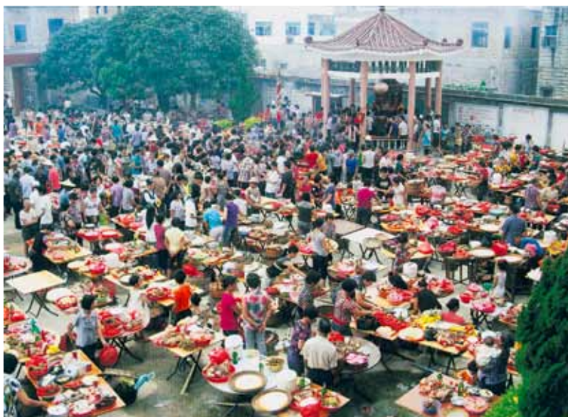
お供え物をする人々