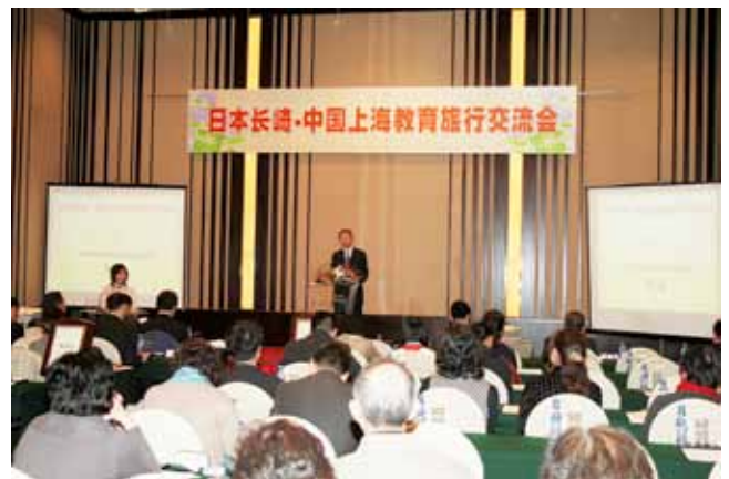
日本長崎・中国上海教育旅行セミナー（11月16日）