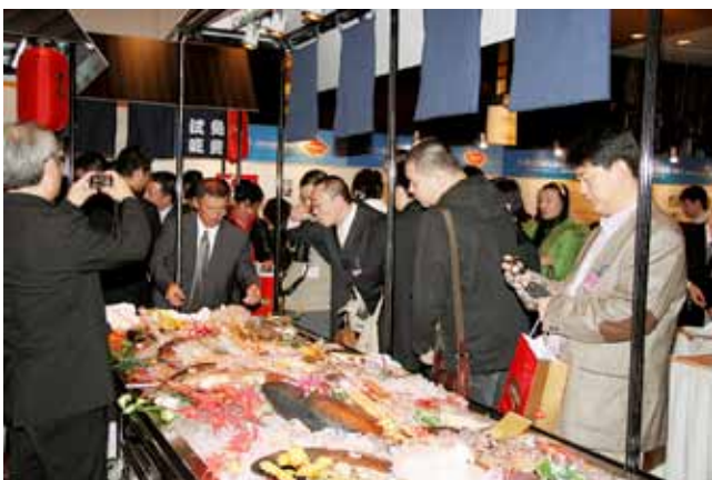
長崎県産品2009北京展示商談会(11月19日)