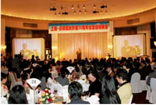
長崎～上海定期航空路線開設30周年記念レセプション(11月17日)