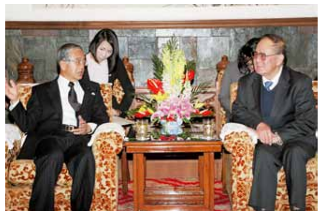
宋健中日友好協会会長との会見(11月19日)