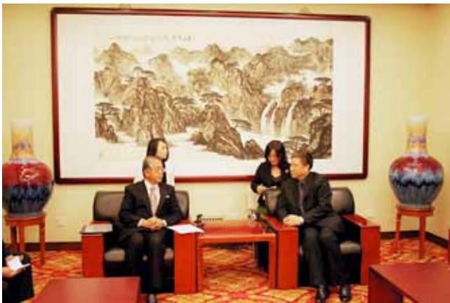
張長明中国中央電視台副台長との会見(11月18日)