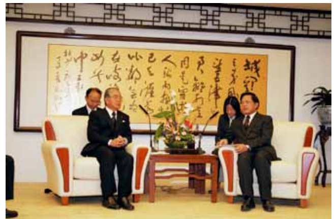
胡正躍外交部部長助理との会見(11月19日)