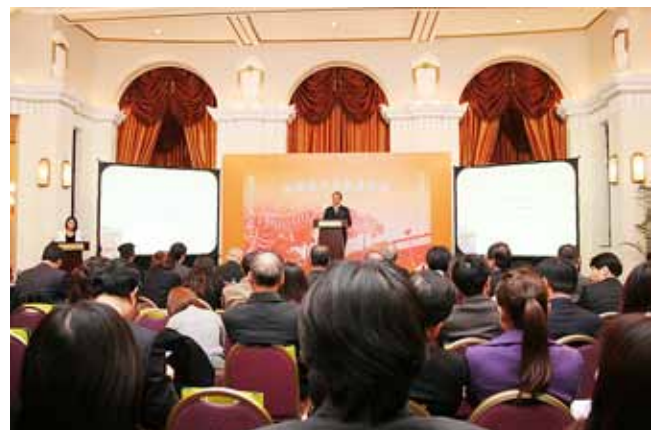
長崎県魅力発信フォーラムin上海（11月17日）