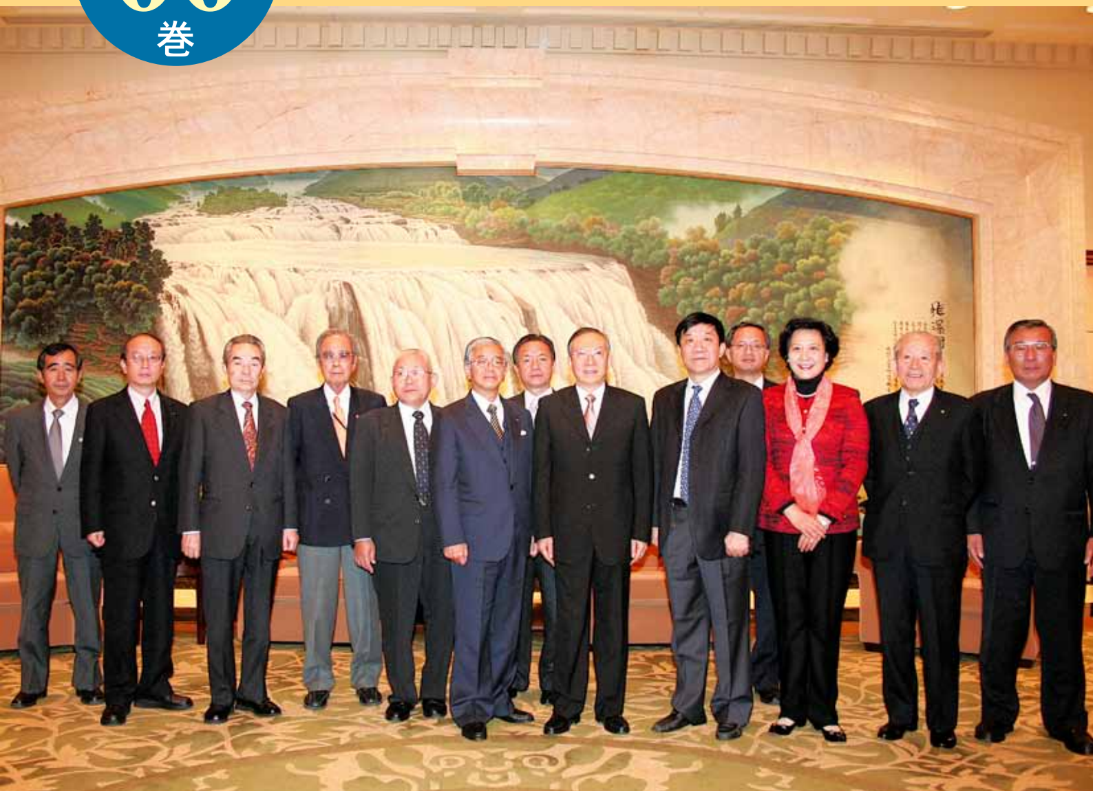
劉雲耕(りゅう うんこう)上海市人民代表大会常務委員会主任表敬訪問 於：2009年11月17日(火) 興国賓館